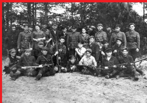
1944 Polsko: les Naliboki Partyzáni z různých jednotek

Naše národy přece trpce zakusili: když je moc dělníků poražena, zrazena nebo vydána napospas, nevyhnutelně se vrací do života národů trvalá válka, opět hrozí nebezpečí světové války pánů. Která z válek posledních desetiletí by vůbec byla rozpoutána, kdyby ještě existovala lidová moc Sovětského svazu, Číny, Polska, ČSSR, Maďarska ...?