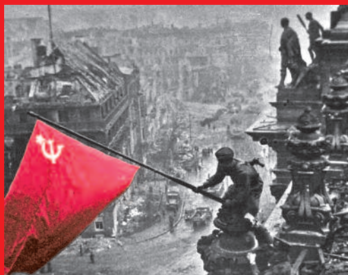
1945 Berlin Reichstag 8. Mai Sieg über den deutschen Faschismus und damit die Befreiung des deutschen Volkes

Ohne den Sozialismus, ohne die Diktatur der Arbeiter in der Sowjetunion wäre der deutsche Faschismus nicht geschlagen worden. Als deswegen nach 1945 Völker beschlossen, nicht andere Herren haben zu wollen sondern keine, als die polnischen Arbeiter sich an den Aufbau Volkspolens machten, als die Arbeiter der Tschechoslowakei statt eines neuen Staats des Kapitals aus den Organen des Widerstands gegen den deutschen Faschismus die Volksdemokratie errichteten, als die Arbeiter im Osten Deutschlands beschlossen: besser zwei Deutschland als die Wiederrichtung des Großdeutschland des Militarismus, des Völkermords und des Krie-