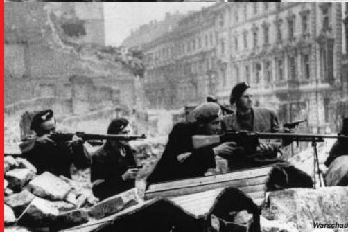
1943/44 Aufstand im Warschauer Ghetto und in Warschau

ges – da haben sie zugleich das ihre getan, einem neuen Weltkrieg der Großmächte zuvorzukommen. Sie haben das getan, was einzig den Frieden sichern kann: Die Macht denen, die allen Reichtum schaffen! Die Macht den Arbeitern und ihren Verbündeten im Volk! Macht im Interesse der Mehrheit, gegen die Minderheit der Ausbeuter und Kriegstreiber!